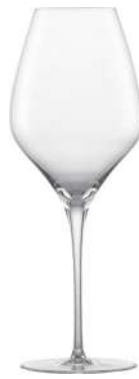
THE FIRST - 50.5 CL