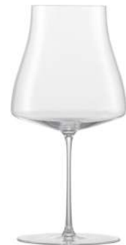
WINE CLASSIC - 81.9 CL