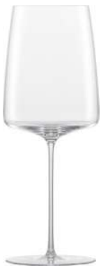
SIMPLIFY - 68.9 CL