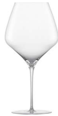
THE FIRST - 95.5 CL