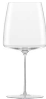
SIMPLIFY - 74 CL