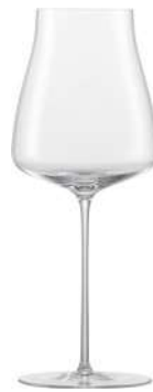
WINE CLASSIC - 45.8 CL