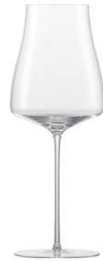
WINE CLASSIC - 54.5 CL